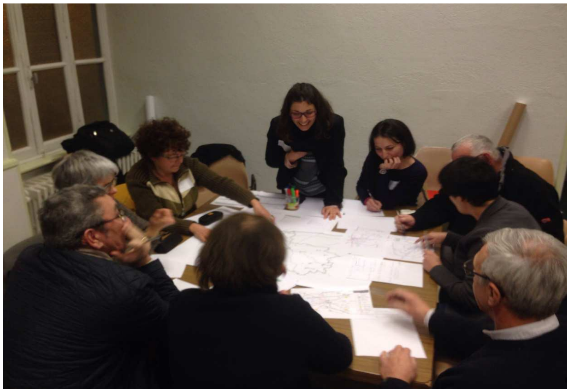
Jeu de territoire sur les alimentations de demain Billom (Grand Clermont, Parc naturel régional Livradois-Forez)

Les lieux et horaires précis vous seront communiqués ultérieurement.